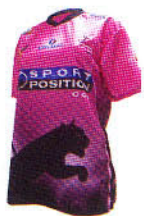
こちらがピンク バージョン