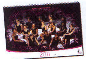
2011年カレンダーの表紙

ビジュアル関連の統一感徹底的。カレンダーではドレスを着用し、ポーズを決める。最近、海外ではセミヌード写真で手取り早いインパクトを求めている女子チームが多いが、レス・パンサレスは安易なセクシー路線を拒否。「品のある女性らしさ+カッコ良い」を追求している。