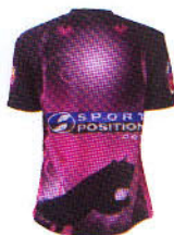
裏面は両肩に注目。 豹の目が光る!