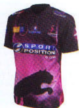
2009-10初代ユニフォーム 黒バージョン

まず目を引くのがユニフォーム。チームカラーのピンクと黒をベースに、日本人にはなかなか着こなせない「お腹に動物」を大胆に配置。さらに背中側は両肩で眼が光っているという斬新すぎるデザインだ。創設2年目となる2010-11シーズンは、より一層パワーアップ。正面全体に豹の顔が描かれ、お腹部分に大きな口と牙が見えるという、前衛的なデザインとなっている。