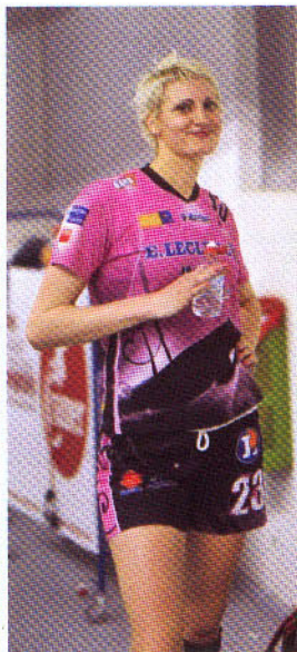
欧州のユニフォームは上下 ともにタイトな仕様が主流